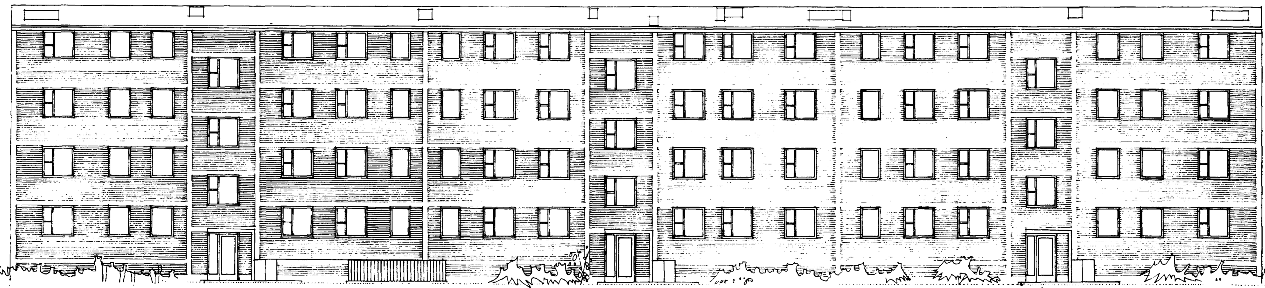
FASAD MOT NÖR