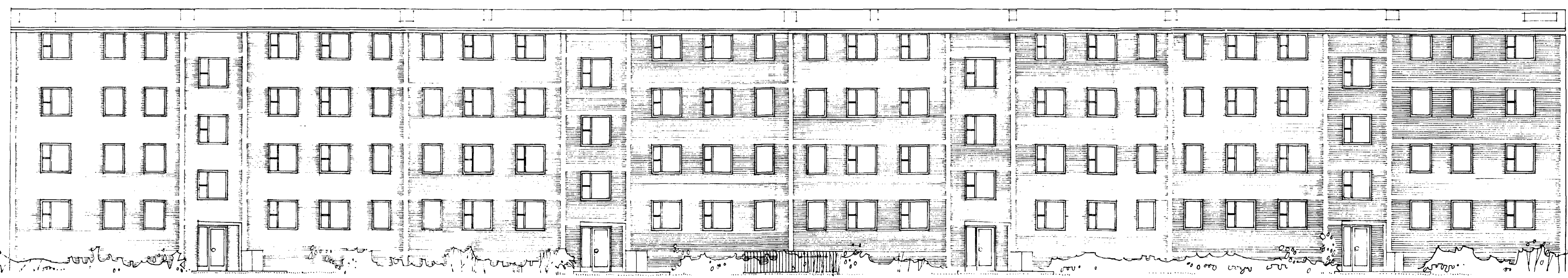
FASAD MOT NÖR